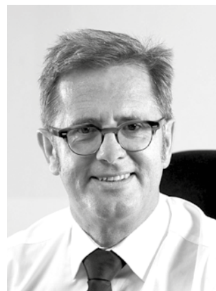
Cliff Allan 教授, 伯明翰城市大学校长

A handwritten signature in black ink, appearing to read 'Cliff Allan'.